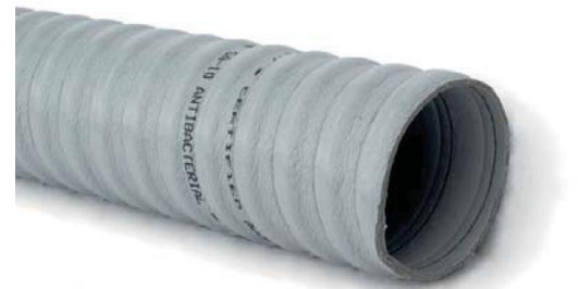
Grafico di selezione rapida dei tubi "AIRSAN"

NOTA IMPORTANTE: per una perdita di carico minima (come in grafico riportato sotto) il tubo deve essere installato disteso pressochè rettilineo e con pareti tese.