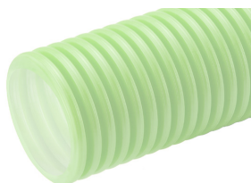
Ø63, Ø75, Ø90