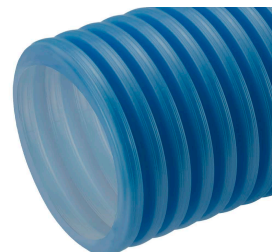
Ø110, Ø125, Ø160, Ø200